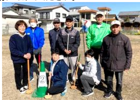
桑部まちづくり拠点施設 (毎週木曜日9時から1時間)