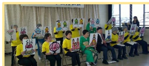
桑部童謡サークル