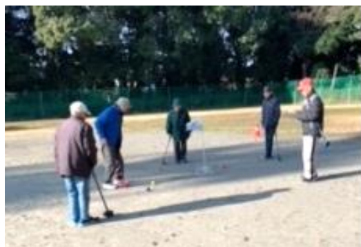
日立グラウンド (毎週水曜日8時から1時間)

みんなでグラウンドゴルフしませんか？ とっても楽しいですよ。道具も参加料も要りません。 一度気楽に覗いてみてください。