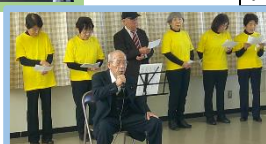
桑部詩吟サークル