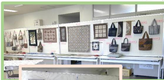
パッチワークキルトと書道の展示

～ 2月24日(土) 桑部まちづくり拠点施設 サークル活動 学習発表会が開催されました ～ 日頃の鍛錬の成果が発表されました。