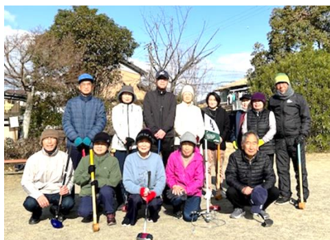
東正和台公園 (第5除く毎週月曜日8:20～)